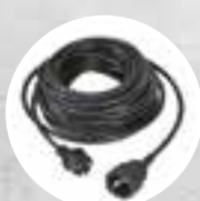
Удлинитель 15 м